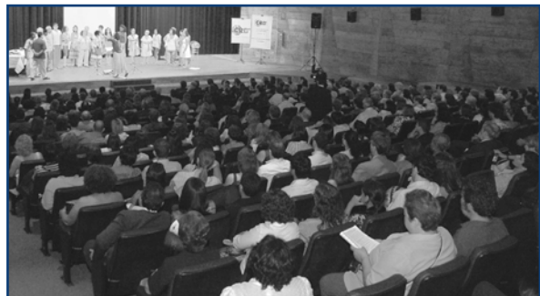
Apresentação do Coral da FESP/SP (acima) e coquetel, da Classic Formaturas, foram graciosamente oferecidos ao público.